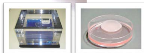
《大阪大学 iPS 細胞由来心筋細胞シート》

《iP-TEC®商品概要》 https://www.sanplatec.co.jp/ipotec/